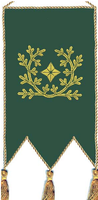
Killan vuonna 2003 uusittu pöytäviiri