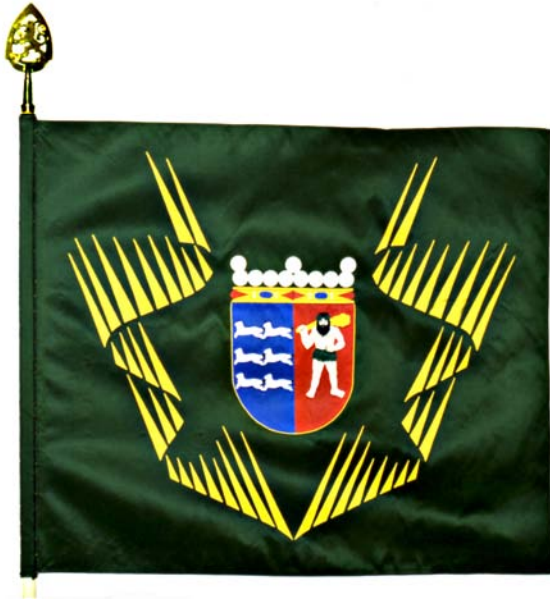
JÄÄKÄRIPRIKAATIN LIPPU 22.11.1982 ALKAEN. LIPPU UUSITTIIN 01.10.2004.