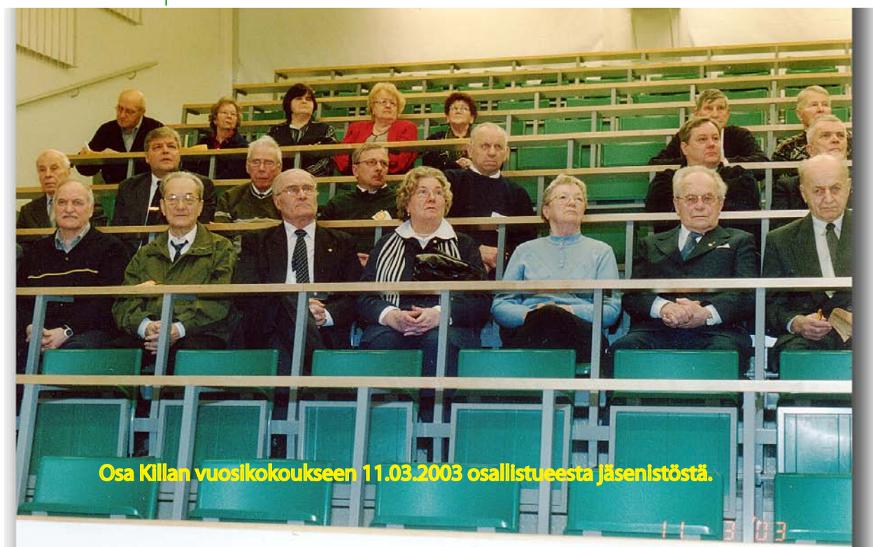
Osa Killan vuosikokoukseen 11.03.2003 osallistuneesta jäsenistöstä.