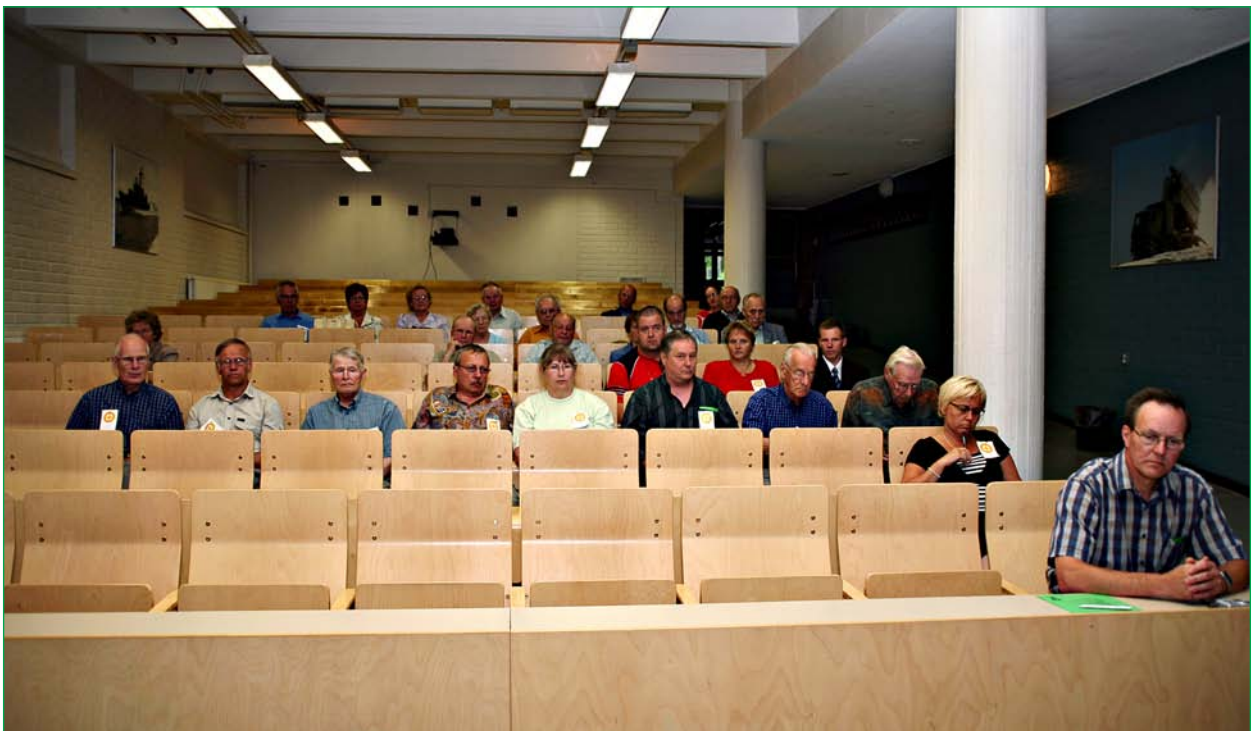
Killan valtuuskunnan kokous Turussa Saaristomeren Meripuolustusalueen Pansion tukikohdan auditoriossa 15.07.2006.