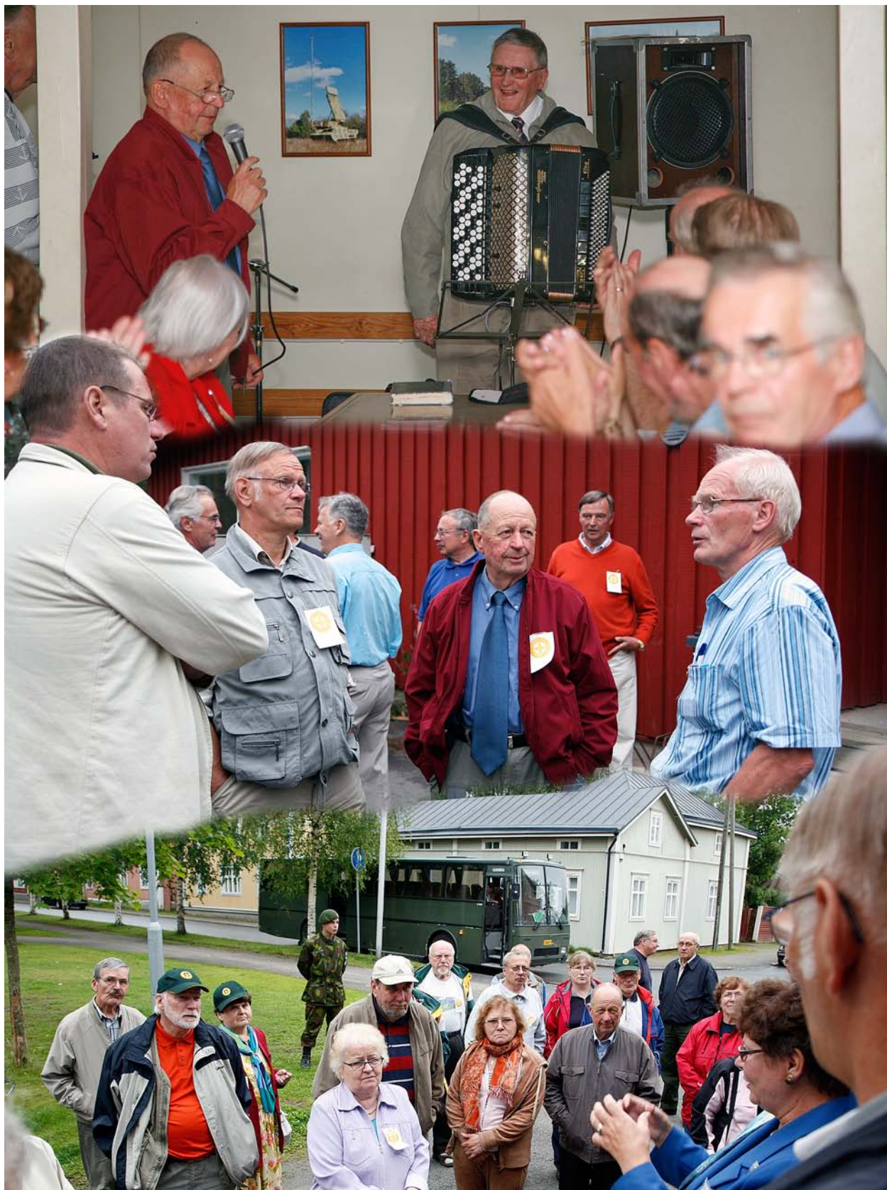
Killan kesäpäivät 2007 vietettiin Lohtajalla tutustuen mm. Kokkolan nähtävyyksiin opastetulla kaupunkikierroksella, vain sää oli heinäkuun alun oloihin viileä.