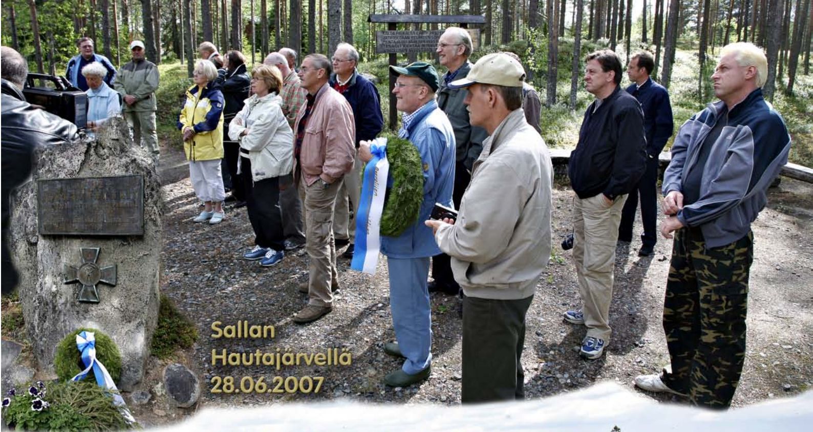
Sallan Hautajärvellä 28.06.2007