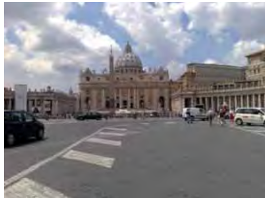
Vatikaanin historiallinen näkymä.