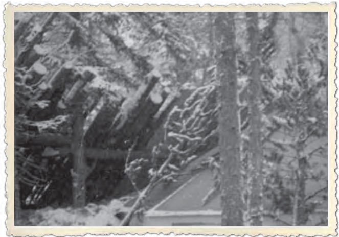
JR 27:n komentotelta Suomussalmella