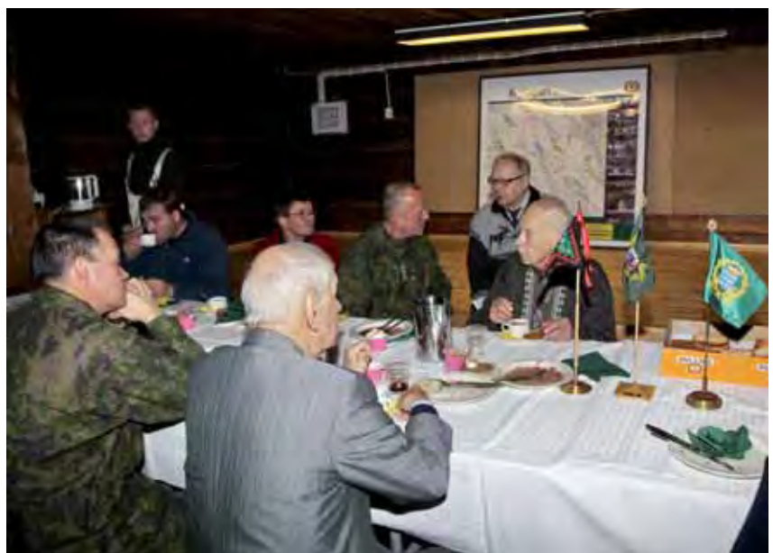
Vieraat muistelivat alueen kehittämisvaiheita.

Juhlatilaisuuden aloitti everstiluutnantti Pekka J Heikkilä esitelmällä "Kyljäjärvi ennen".