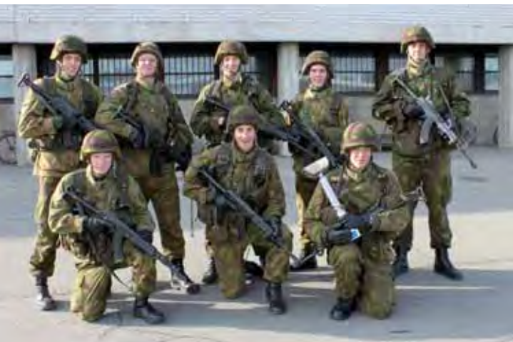
Jääkärikilpailun voitti 3. Jääkärikomppania Pohjan Jääkäripataljoonasta.