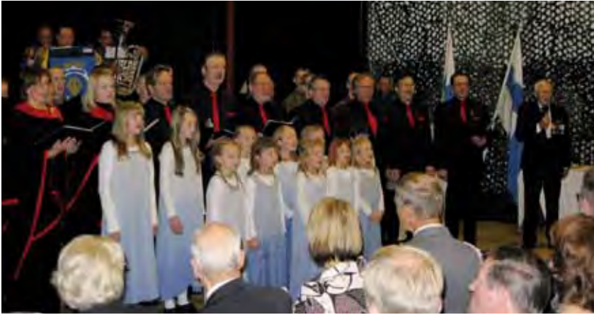
Tasokkaat musiikkiesitykset huipentuvat Lapin Sotilassoittokunnan, kuorojen sekä Armas Ilvon yhteisesitykseen Veteraanin Iltahuuto.