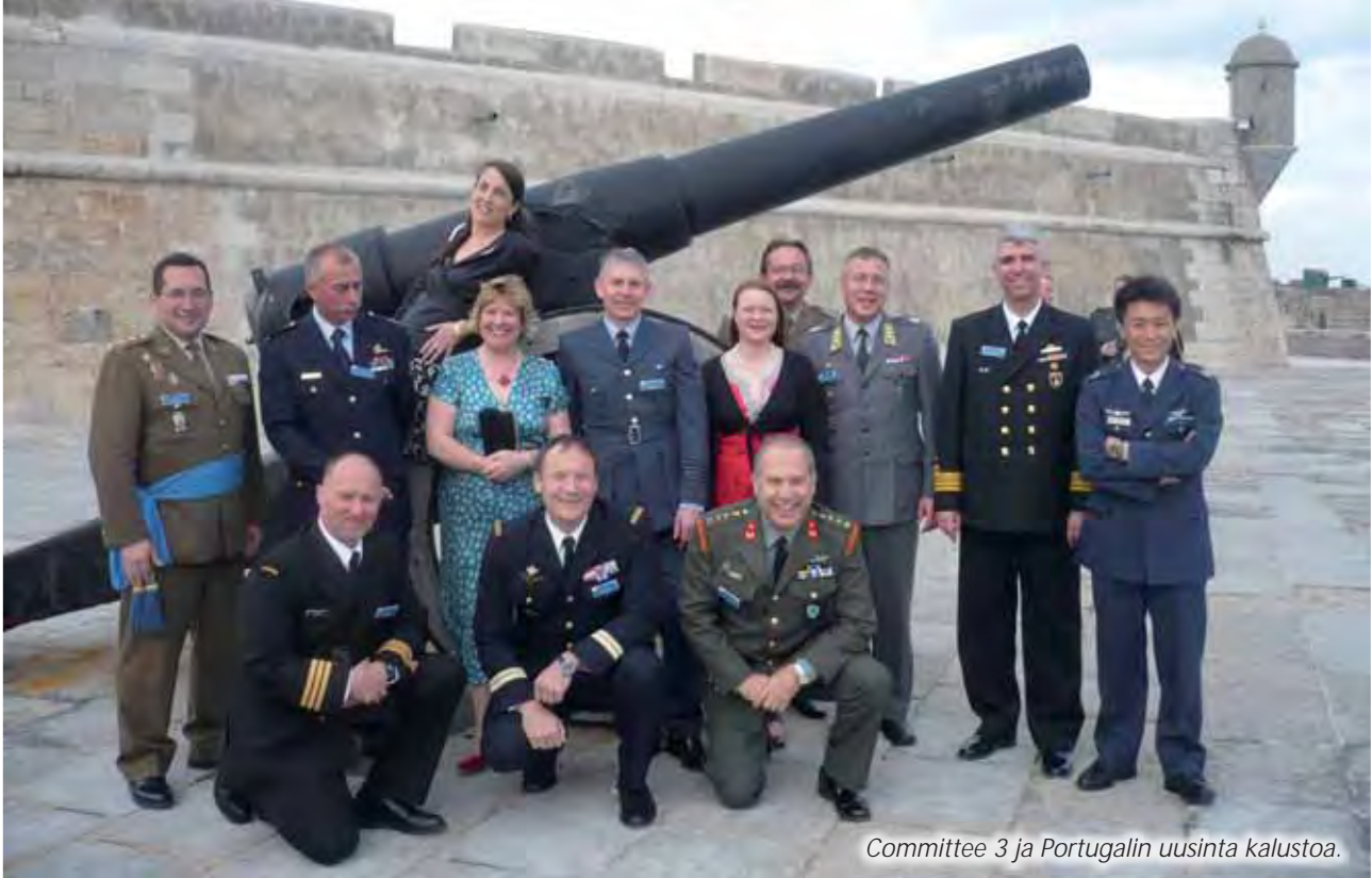
Committee 3 ja Portugalin uusinta kalustoa.

täni sopivat T-paidan ja shortsien käyttöön, kun lämpötilat olivat noin + 20 astetta. Italialaiset tosin pukeutuvat vielä silloin talvitakkiin ja jopa pipoon. Koskaan ennen ei hölkkäävän Lehdon pojan sääriä ole tuijoteltu niin paljon.