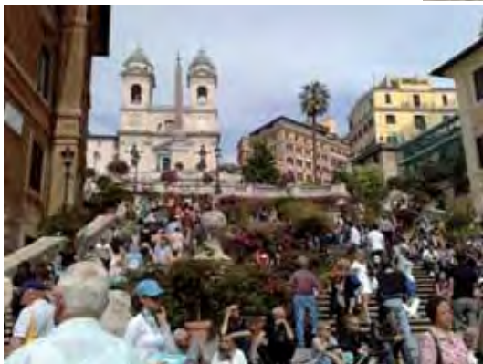
Espanjalaiset portaat Roomassa.