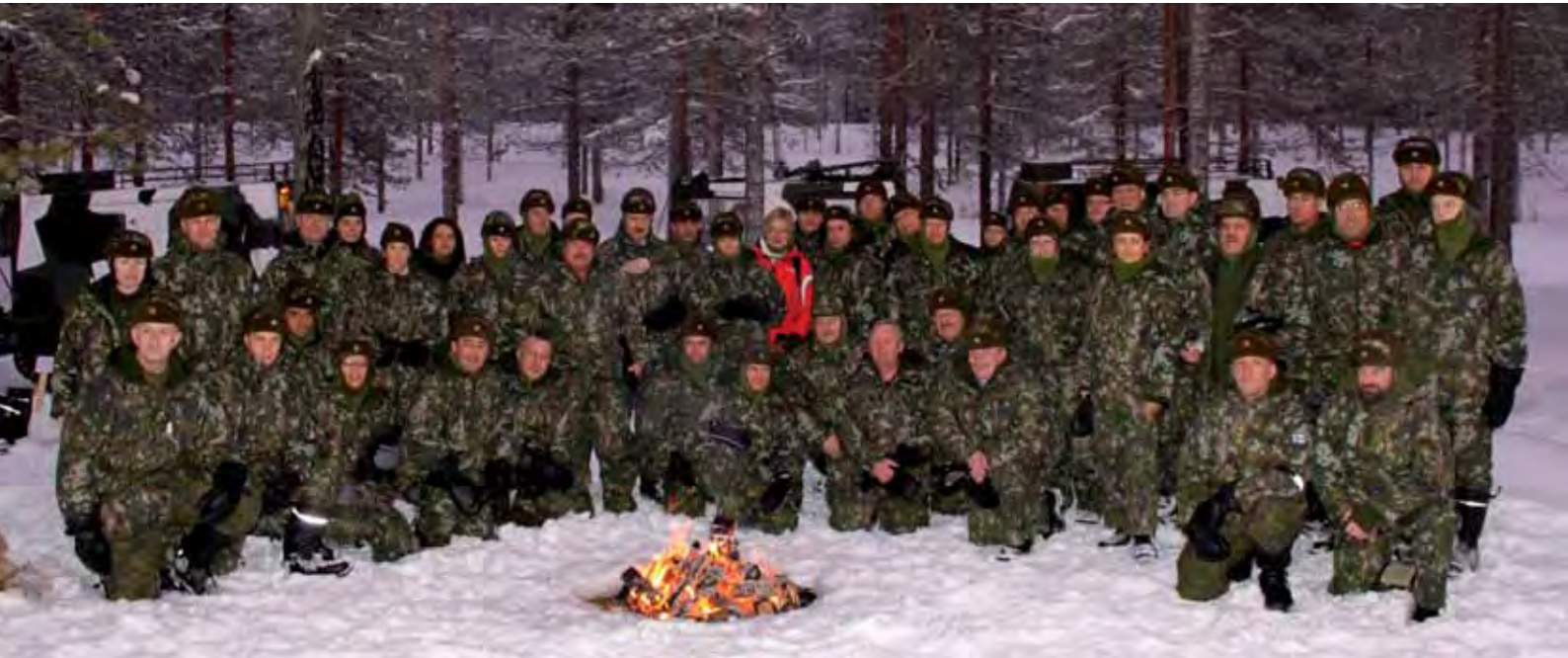
Isännät ja vieraat yhteispotretissa.