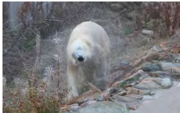
Arktiset eläimet Ranuan eläinpuistossa näyttivät kiltal- laisille parastaan puistoon päästyämme ja makupalojen kerjääminen sujui rutiinilla.

Jääkäripataljoona 1 ei kuulunut jat- kosodan aikana Jääkäriprikaatiin, vaan Ratsuväkiprikaatiin (RvPr) ja ryhmä Oino- seen ja osallistui Lapin sotaan vain Tornio- n varuskuntajoukkona ja sotasaaliin ke- räämiseen eri puolilla Lappia.