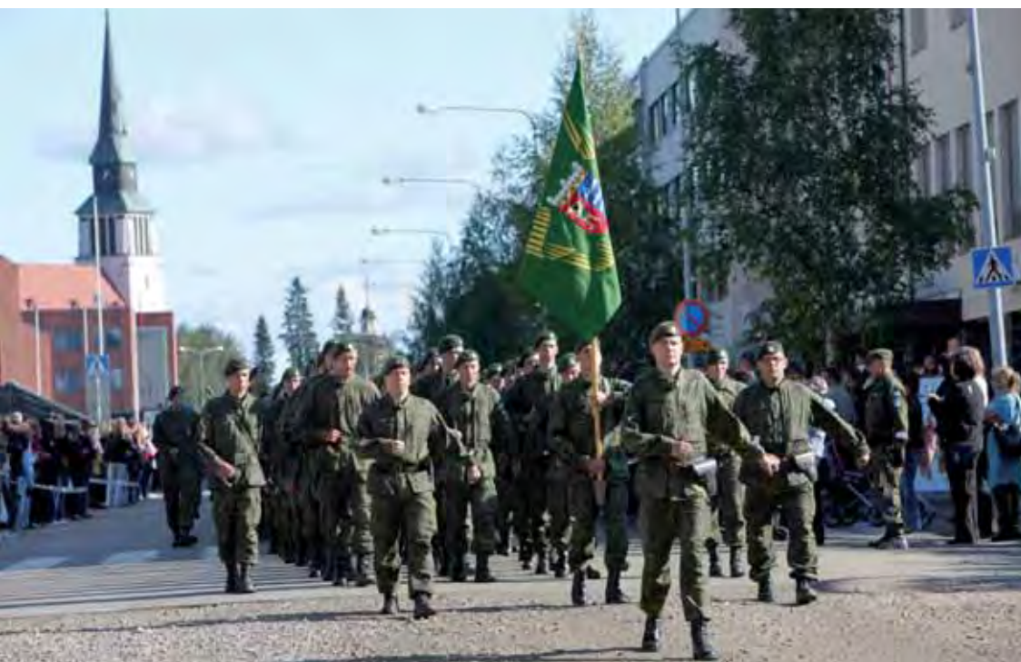
Ohimarssi Kemijärven keskustassa.

Kalustoesittely oli järjestetty Ahvensalmen kentän pohjoisosaan klo 09.00-15.00 väliseksi ajaksi. Kalustoesittely keräsi erittäin runsaasti yleisöä ja herätti mielenkiintoa.