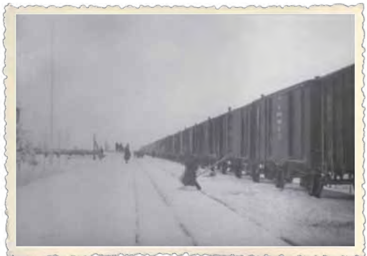
Matka rintamalle alkaa.

7.12. sai JR 27 kuormauskäslyn juniin. Rykmentin siirtokuljetus Hyrynsalmelle ei alkanut kovin lupaavissa merkeissä. Etukäteen Kajaanin kautta Hyrynsalmelle matkustanut eversti Siilasvuo sai 8.12. tiedon ensimmäisen joukkojen kuljetusjunan ajaneen yhteen tavarajunan kanssa! Junaonnettomuudesta huolimatta tuskallisesti odotettu ensimmäinen kuljetus saapui Hyrynsalmelle 9.12. heti keskiyön jälkeen. Yhteentörmäyksessä oli tuhoutunut jonkin verran ajoneuvoja ja muita tarvikkeita. Onneksi kuitenkin miehet ja hevoset olivat päässeet pelkällä säikähdyksellä.