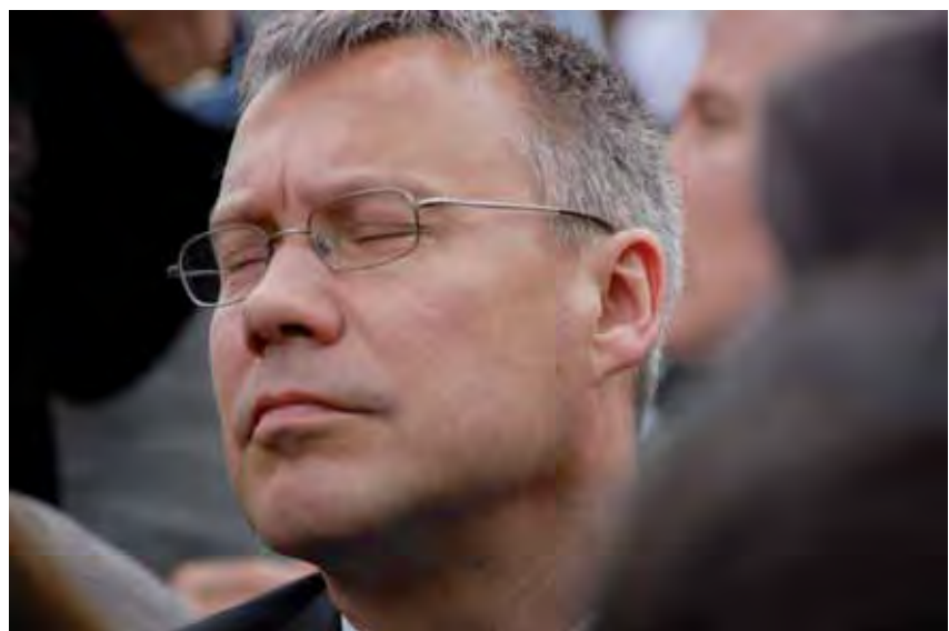
Näin harras tunnelma oli Paavin pääsiäisvastaanotolla.

Suomalaisen upseerin koulutus antaa hyvät eväät tällaiseenkin ympäristöön. Pienen maan edustajan uhoamaton joustavuus selvittää välillä hankalatkin erimielisyydet. Pohjoiseurooppalainen tehokkuus ja rehellisyys saivat kiitosta ja toisissa jopa pientä kateutta. Kaiken kaikkiaan "makaroni laajeni" melkoisesti. Tunnen oloni todella kiitolliseksi tästä mahdollisuudesta ja toivon voivani antaa mahdollisimman paljon saamastani pääomasta takaisin Suomen ja suomalaisten turvallisuudelle.