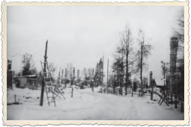
Suomussalmen tuhottua kirkonkylää.

Venäläiset yrittivät tulla saarretun 54. Kaaderidivisioonan avuksi myös hiihtojoukoin. Tämä toiminta huipentui kokonaisen hiihtoprikaatin hyökkäykseen. Se oli venäläisten ensimmäinen yritys käyttää hiihtojoukkoja suurissa puitteissa. Hiihtoprikaatia johti eversti Dolin. Dolinin hiihtoprikaati tuhottiin pääosin JR 27 joukkojen toimesta 16.2. mennessä. Nelipäiväisissä taisteluissa valtioprikaatin 1800 miehestä kaatui noin 1700 vihollisotilasta. Kaatuneiden joukossa oli myös hiihtoprikaatin komenta-