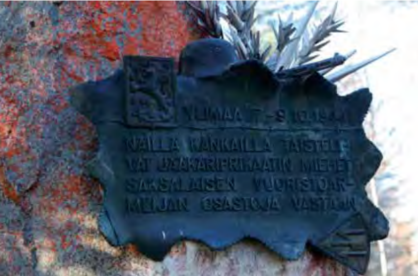
Ylimaán taistelun muisto- merkki.