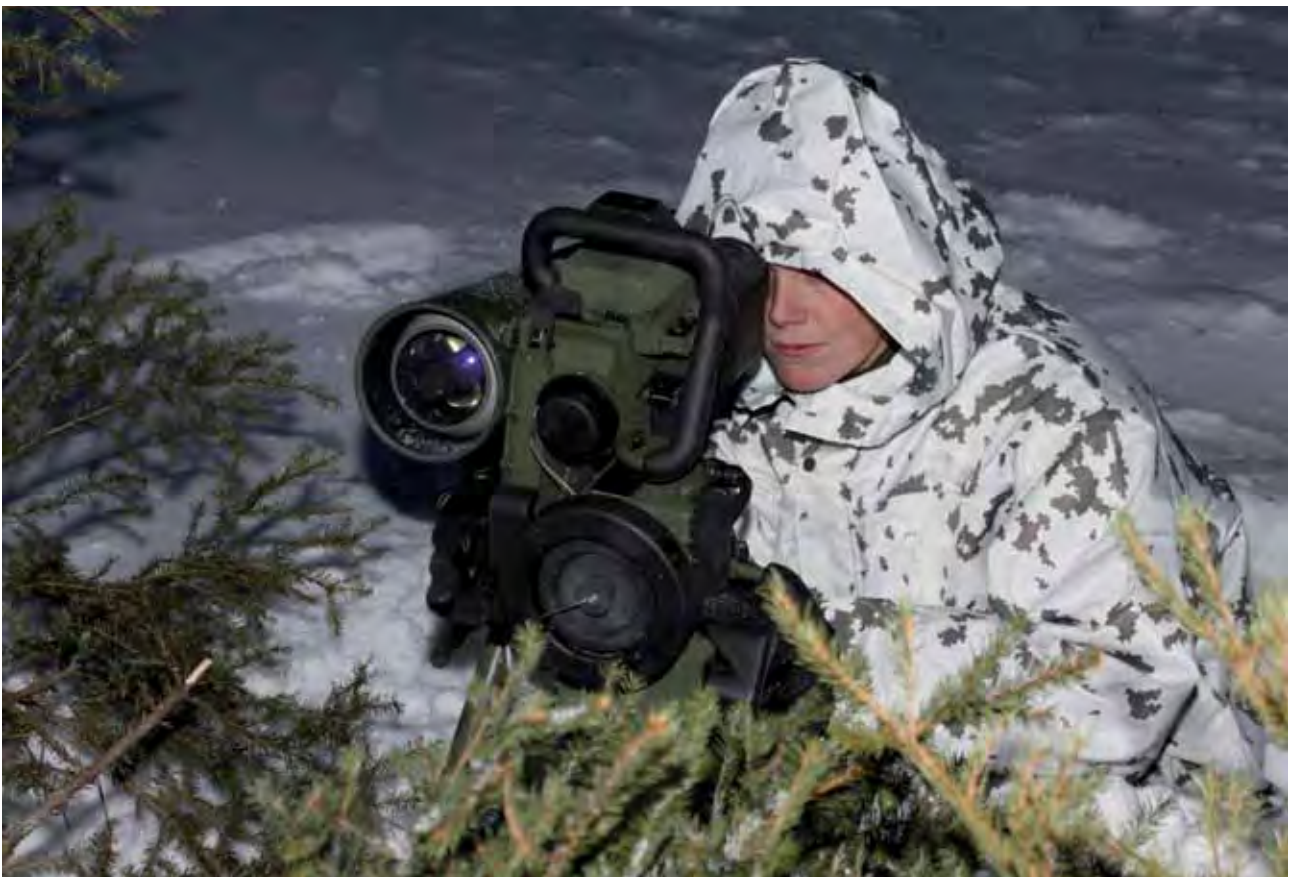
Panssarintorjuntaohjus 2000M on kolmannen sukupolven panssarintorjuntaohjus. Jääkäriprikaati kouluttaa vuosittain ohjusjärjestelmälle yhden joukkueen syksyn saapumiserastä. Joukkueen ryhmänjohtajat koulutetaan kevään aliupseerikurssilla.

Panssarintorjuntaohjusjoukkueet organisoitiin kolmeen kuvitteellisen jääkäripataljoonaan, joita ”pelaavat” komentajat käskivät joukkueille seuraavan vuorokauden taisteluihin kuuluvat asiat. Jääkäripataljoonaan kuuluvia joukkueita ja komppanioita ei harjoituksessa ollut, joten pataljoonien komentajat ja tulenjohtokomentajat kuvasivat puuttuvat joukot panssarintorjuntaohjusjoukkueiden johtajille tarkasti.