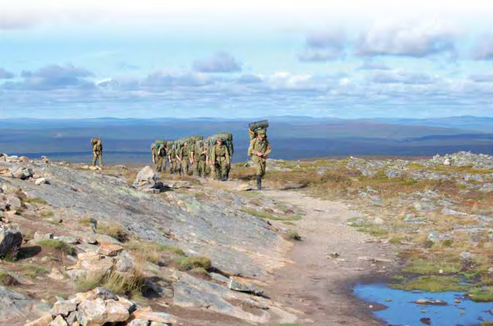
Ensimmäisen marssiosuuden näkymissä ei valittamista ollut!

Jääkäriprikaatin perinteinen kokelasvaellus suuntautui tänä syksynä Saariselälle Urho Kekkosen kansallispuiston maisemiin 1.–3.9.2009. Marsireitti kiersi Kiilopään tunturialueelta Suomujokivarteen, jokivarren metsäalueita pitkin Suomenruoktulle, josta takaisin Kiilopäälle. Kolmen päivän aikana matkaa kertyi noin 60 km.