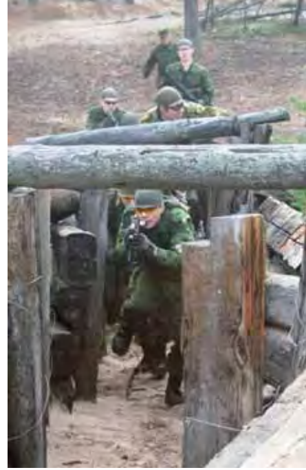
Ryhmä hyökkää oikealta ja konekivääritaistelijapari tukee