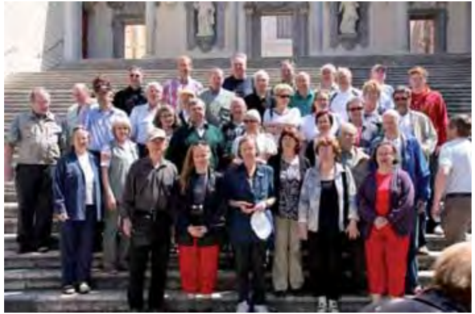
Kiltalaisia Monte Cassinin luostarin sisäpihan portailla.

Tietoa killan toiminnasta löytyy killan kotisivuilta, www.pohjanprikaatinkilta.fi/