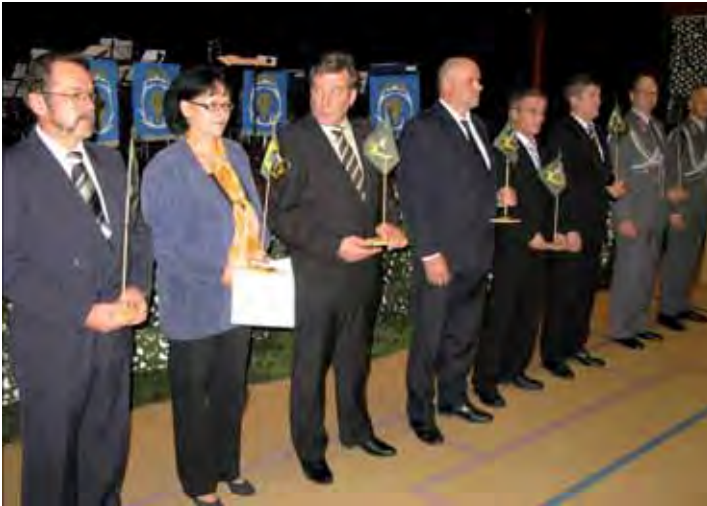
Jääkäriprikaatin pienoislipulla palkittuja.