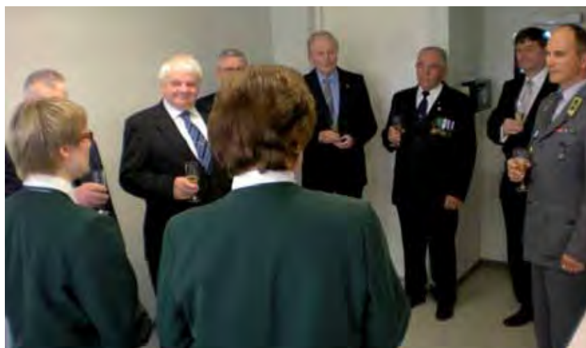
Tervehdysvuorossa SOMAJYTY:n edustajat.