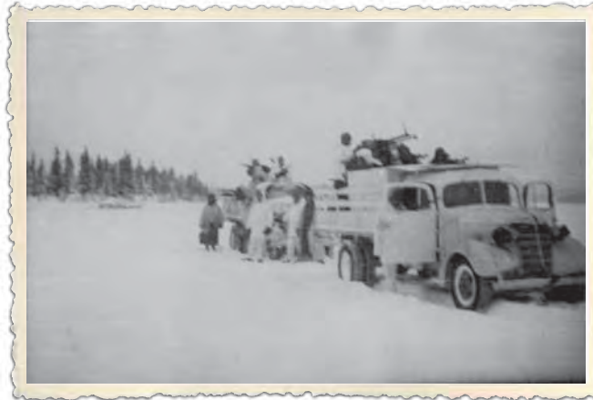
Kiantajärven jäällä pakenevia vihollisia takaa ajanut ilmator- juntakone- kiväärillä varustettu kuorma-auto- osasto.