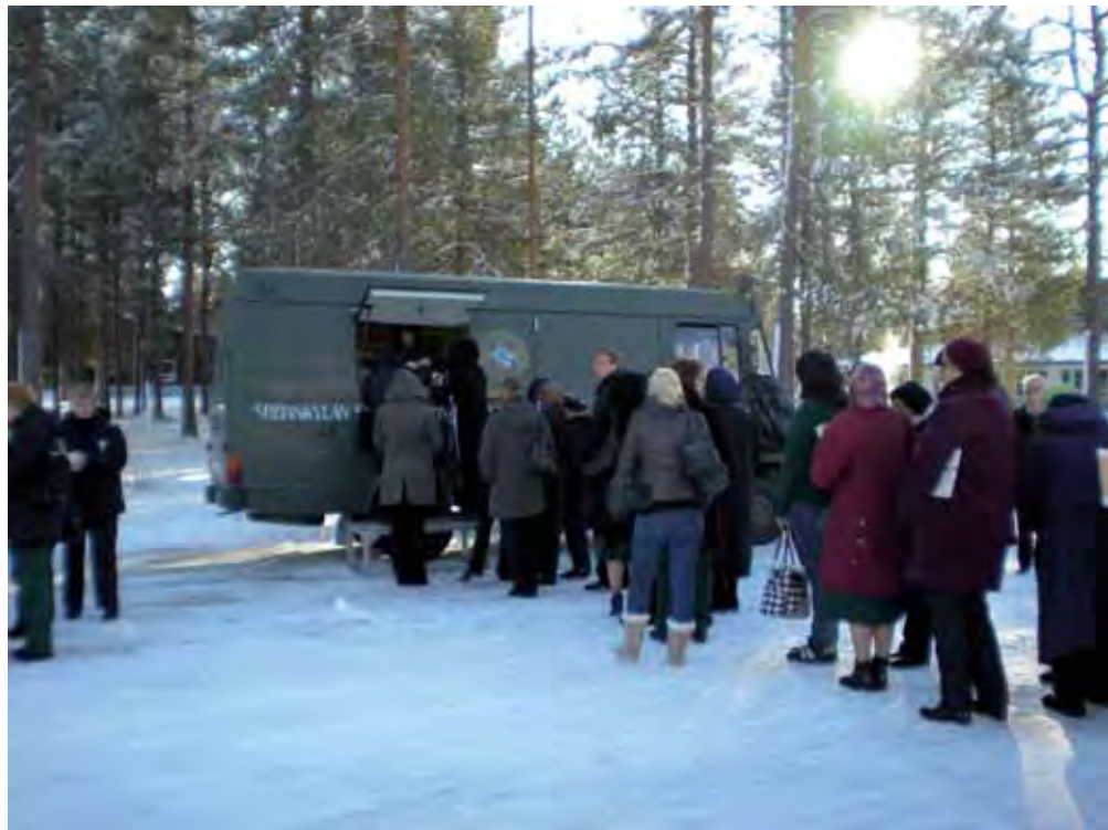
Auditoriossa vietetyn aamupäivän jälkeen sisaret pääsivät kokeilemaan, miltä sotilaskoti-autosta jonottaminen tuntuu kun päiväkahvit tarjottiin sieltä. Saimme nauttia myös melkein keväisestä säästä; aurinko paistoi ja räystäistä tippui vesi.