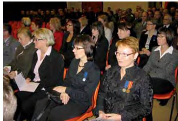
Jääkäriprikaatilaista ja Jääkäriprikaatin ystäviä.