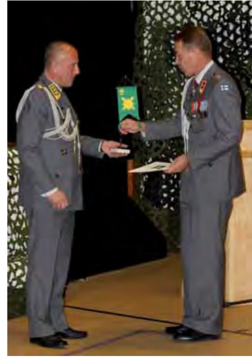
Prikaatikenraali Jukka Haaksiala luovutti Jääkäriprikaatille Pohjois-Suomen Sotilasläänin standaarin.