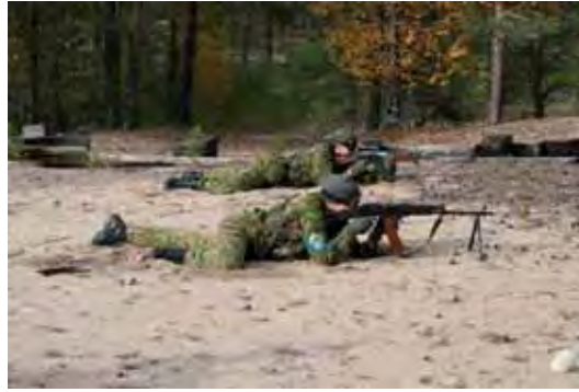
Konekivääritaistelijapari tukee taisteluhaudan vyörytystä