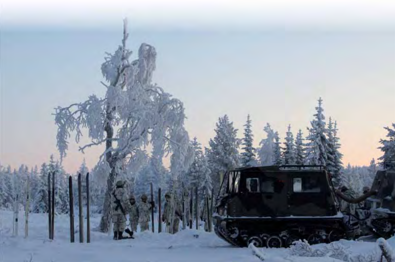
AAPA 09 harjoitus on päättynyt, joukot valmistautuvat paluumarsseihin.

Kunnossapitojoukkue sai runsaasti muun muassa ajoneuvojen korjaustehtäviä. Täydennys- ja kuljetusjoukkueen eri ryhmät vastasivat elintarvikkeiden, polttoaineiden ja taisteluvälineiden jakamisesta harjoitusjoukoille. Työkoneryhmä siirtyi alueelle jo kolme päivää muuta joukkoa aikaisemmin ja huolehti alueen auraamisesta, jotta harjoitusjoukot pääsivät liikkumaan sujuvasti.