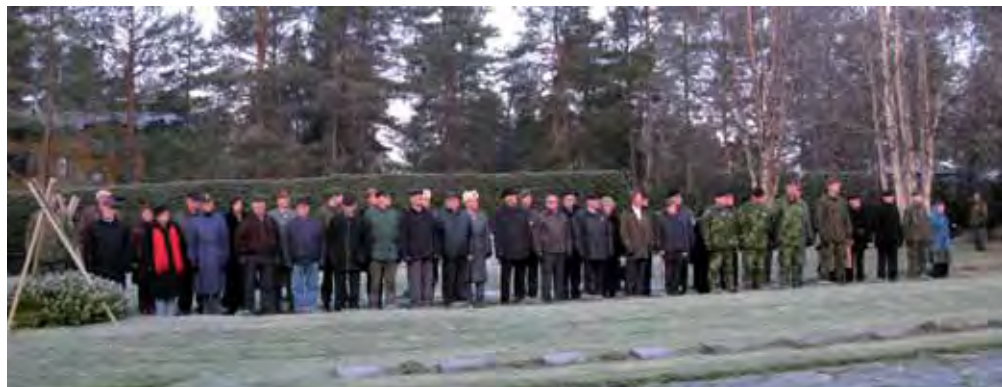
Suomen vapauden puolesta taistelleiden muiston kunnioittamista oli seuraamassa runsas joukko nykyisiä ja entisiä jääkäriprikaatilaisia, kiltalaisia sekä Jääkäriprikaatin ystäviä ja yhteistyökumppaneita.

Sepeleenlaskujen jälkeen Jääkäriprikaatin henkilökunta kokoontui Siilashallille juhlapäivän yhteisvalokuvausta varten.