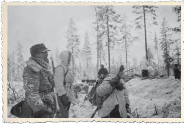
Loppupuhdistus päättymässä Löytövaarassa.

ja eversti Dolin. Kuhmossa tuhottiin lisäksi siperialainen lumipuvuin ja auto-maattisein varustautunut valiohiihtopataljoona.