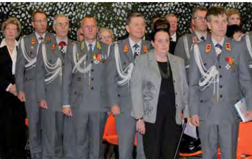
Jääkäriprikaatin lippu poistuu...