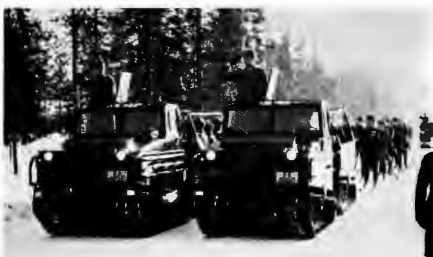
1. Jääkärikomppania ohimars- sissa.