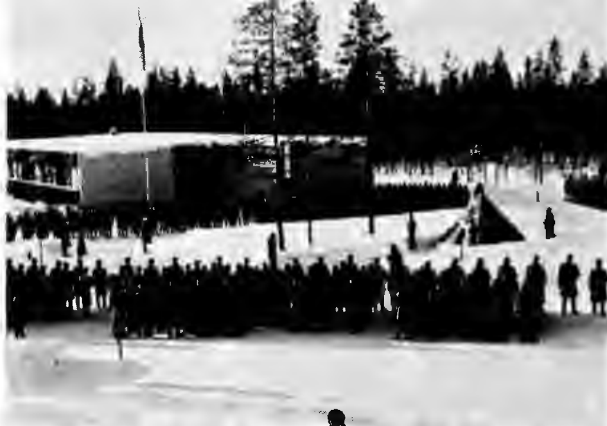
Lapin Jääkäripataljoona 50-v. paraatikatselemuksessa Joutselän patsaalla 11. 3. 1971.