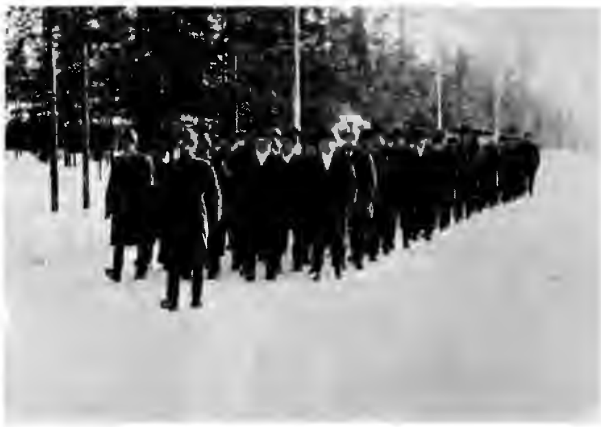
Ja ryhdikkäinä he suorittivat ohimarsssinsa.