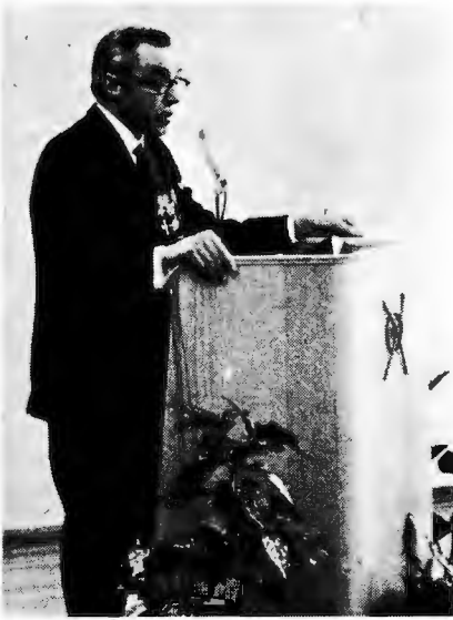
KANSLERI KLAUS VARIS: